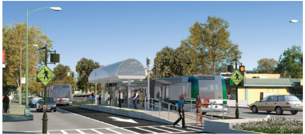
의 시뮬레이션 International Blvd. at 99th Ave

본 회의에서는 정보제공을 위한 오픈하우스와 개요 발표가 있을 예정입니다. 2012년2월 3일에서 3월 19일 기간동안 서면을 포함한 어떤 질문도 가능합니다.